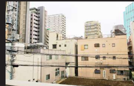
バルコニーからの眺め