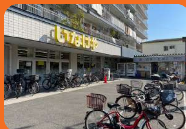
スーパーいなげや