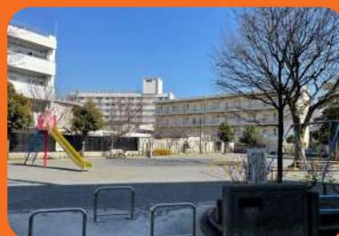
目の前に東蒔田公園

●所在地/神奈川県 横浜市南区 東蒔田町3-15 ●交通/横浜市営ブルーライン「吉野町駅」徒歩7分、京急本線「南太田駅」徒歩9分、横浜市営ブルーライン「蒔田駅」徒歩10分 ●土地権利/所有権 ●建物構造/鉄筋コンクリート造地上7階建1階部分 ●総戸数/69戸 ●築年数/1973年10月 ●専有面積/45.00㎡ ●管理形態/全部委託管理 ●管理会社/長谷工コミュニティ ●管理費/月額8,640円 ●修繕積立金/月額8,640円 ●現況/空室 ●引渡/即可 ●取引形態/売主