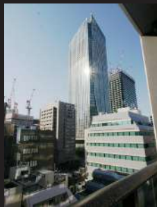
バルコニーからの眺望