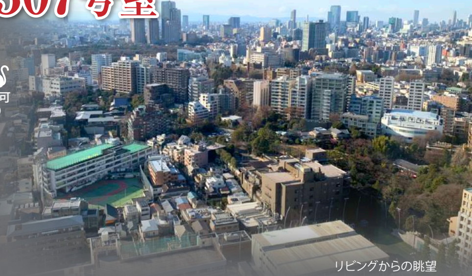
リビングからの眺望