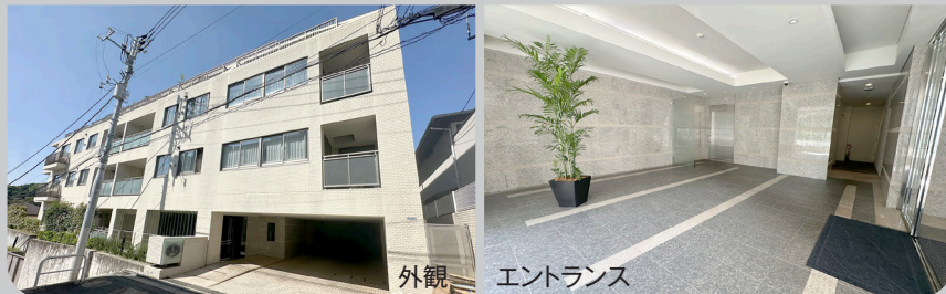
外観 エントランス

【物件概要】●所在地/東京都港区高輪4丁目14-14●交通/都営浅草線「高輪台」駅徒歩9分、JR山手線「品川」駅徒歩10分、「五反田」駅徒歩10分●土地権利/所有権●建物構造/鉄筋コンクリート造地上7階建●総戸数/45戸●築年数/平成17年8月●間取/1LDK●専有面積/36.61㎡●バルコニー面積/5.80㎡●管理形態/全部委託管理●管理会社/三井不動産レジデンシャルサービス株式会社●管理費/月額13,100円●修繕積立金/月額6,600円●現況/空室●引渡/即可●取引形態/専任