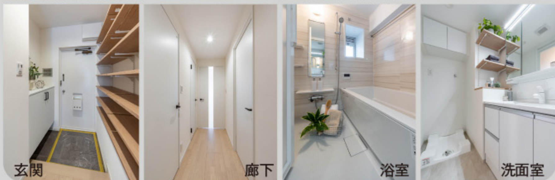
玄関 廊下 浴室 洗面室

【物件概要】●所在地/東京都渋谷区代々木3-33-14●交通/京王線「新宿」駅徒歩11分、小田急小田原線「参宮橋」駅徒歩9分、京王線「初台」駅徒歩11分●土地権利/所有権●建物構造/RC造7階建3階部分●総戸数/26戸●築年数/1970年3月(昭和45年)●間取/2LDK●専有面積/57.00㎡●バルコニー面積/7.23㎡●管理形態/全部委託管理●管理会社/株式会社東京建物アメニティサポート●管理費/月額15,210円●修繕積立金/月額22,380円●現況/空室●引渡/即可●取引形態/売主